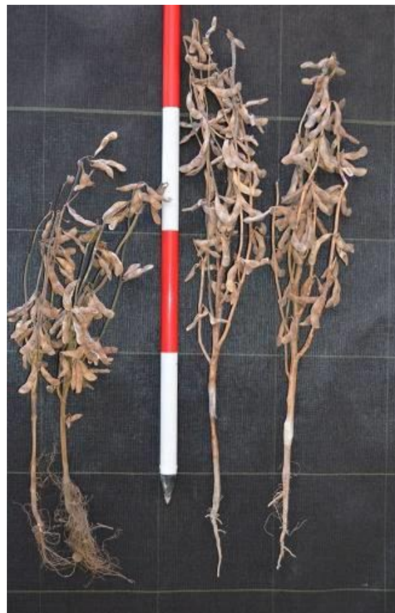
写真2 草本(左:タチナガハ、右:里のほほえみ)