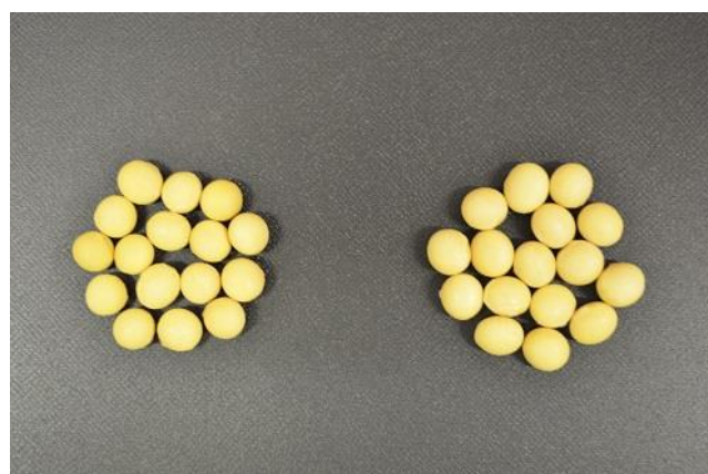
写真1 子実(左:タチナガハ、右:里のほほえみ)