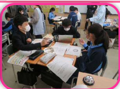
川口市立高等学校附属中学校