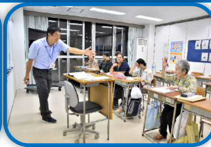
夜間中学(芝西中学校陽春分校)