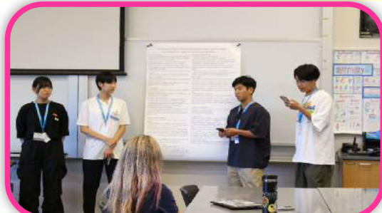
川口市立高等学校 プナハウススクール(ハワイ)における科学プレゼンテーション