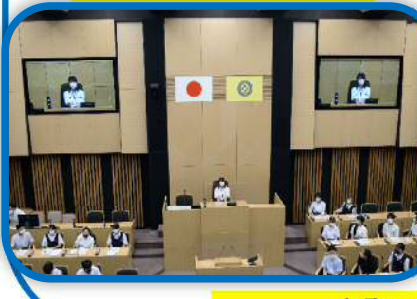
市長とのふれあいトーク