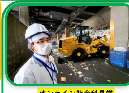
オンライン社会科見学 リサイクルプラザ

歴史的資源をはじめとするさまざまな地域資源・人材を掘り起こし、教材化を図ったり、広く周知を図ったりすることで、児童生徒、市民の社会や郷土に関する理解を深め、郷土への誇りや愛着を一層高めます。