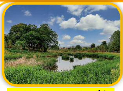
イイナパーク川口 トンボ池

自己実現をめざす市民の多様な学習・活動意欲の高まりに対応するため、さまざまな支援を行い、一人ひとりの個性や魅力を伸ばす環境をつくりまします。