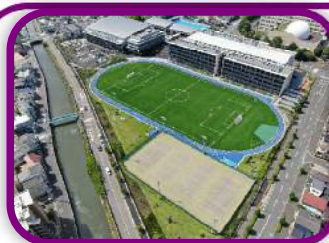
川口市立高等学校グラウンド

教育関連施設を教育行政の資源と捉え、安全かつ適正に整備することにより、教育行政経営の基盤強化を図るとともに、効率的な管理・運営を行うことにより、良好な教育環境のもとで市民の、自己教育、相互教育の発展をめざします。