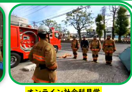
オンライン社会科見学 消防局