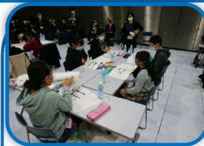
いじめゼロサミット

学校・家庭・地域と行政が相互に補完・連携しながら、さまざまな社会経験の場や見守りの機会を増やし、子どもの成長をサポートする基盤をより強固なものにしていきます。