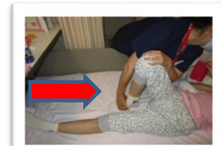
股関節のストレッチ

3病棟では、ベッドサイドで看護師による 関節のストレッチを行っています。 オムツ交換や更衣時などに行うことで、 関節の拘縮予防や可動域の拡大につながり 患者さんに対してのプレゼントになります。 (痛みや可動域の制限の有無など医師や訓練士に 相談し実施しています)