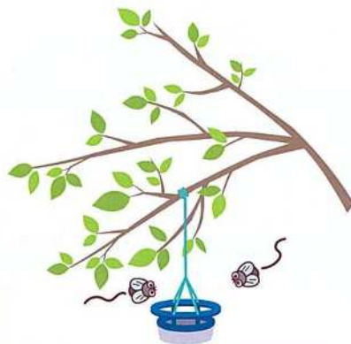
フェロモン剤による誘引