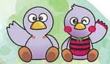
埼玉県マスコット 「コバトン」「ざいたまっち」

学校、保育所、病院、公園等の公共施設内の植物、 街路樹、住宅地に近接する農地（市民農園や家庭菜園 を含む）、森林等が対象となります。