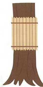
コモ巻きによる 害虫の捕殺