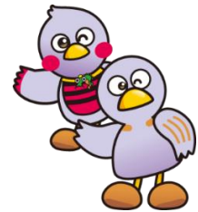
埼玉県マスコット さいたまっちょ&コバトン

※ 保育サービスは、6か月以上の未就学のお子さまに限ります。 無料、定員10名（申込順）