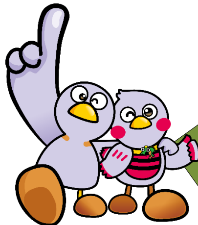
埼玉県マスコット「コバトン」「さいたまっち」