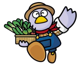
埼玉県マスコット「コバトン」