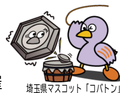
埼玉県マスコット「コバトン」