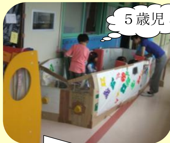
おばけやしき行きのバス 入口で、おばけやしきに入るのを待っています。