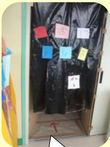
おばけやしきの入口