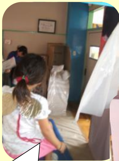
背中に羽根をつけたおばけ。 おばけになりきっています。 奥には、ミイラがいます。