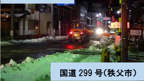
国道 299 号(秩父市)