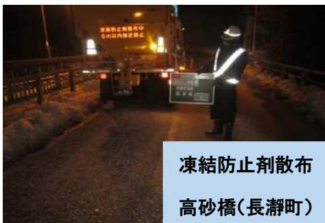
凍結防止剤散布 高砂橋(長瀬町)