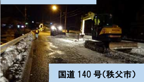
国道 140 号(秩父市)