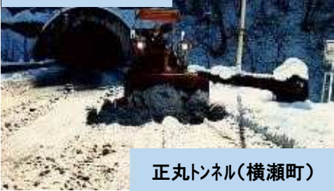
正丸トンネル(横瀬町)