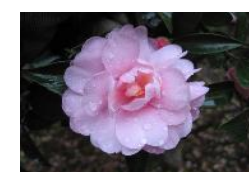
カンツバキ 乙女サザンカ