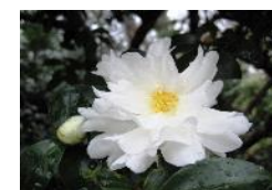
カンツバキ 富士の峰

早咲きのツバキ、サザンカ、カンツバキなどが咲いています。当センターでは、ツバキ・サザンカの490品種を保存しており、その多くを展示しています。これから様々な品種が園内各所で順次開花します。