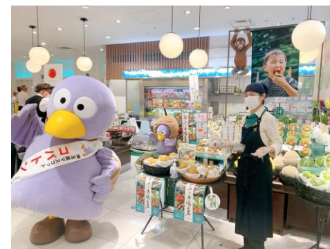
昨年度のフェアの様子(フレッシュワン大丸東京店)