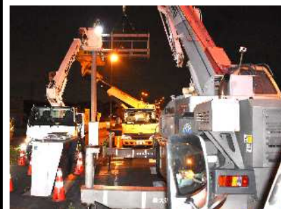
新たに電気通信工事業へ参画