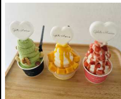
地域農産物を使用した オリジナルジェラート