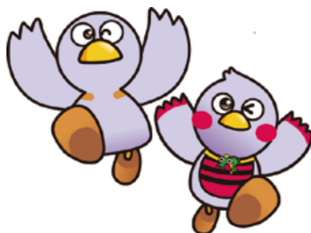
埼玉県のマスコット コバトン&さいたまっち