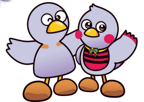
埼玉県のマスコット コバトン&さいたまっち