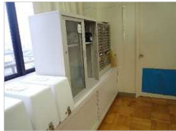
写真2 積み重ねられ 固定されていない棚