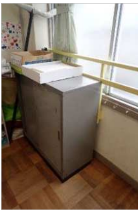
写真1 教室の窓際に 設置された棚

消費者安全調査委員会は、被害の発生又は拡大の防止を図るため、小中学生が被災した事故等のうち、主に学校の施設又は設備が原因で発生したと考えられる事故等について、公立の小中学校を中心に調査を行うこととした(写真1、2は、訪問した学校において確認された、死亡の危険のある設備例)。