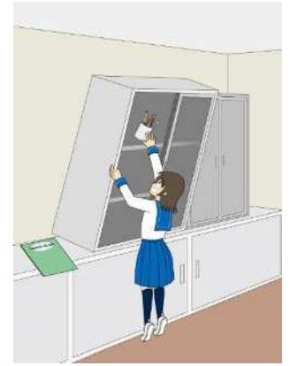
図2 事故のイメージ (棚の転倒及び落下)