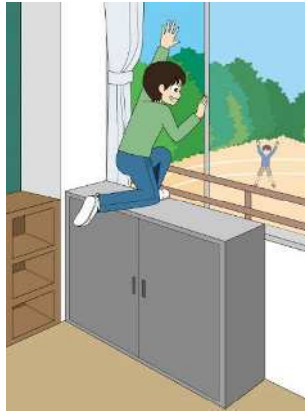
図1 事故のイメージ (棚に登り窓から転落)