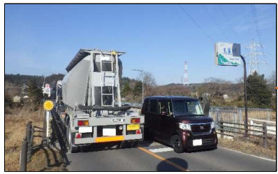
南平沢工区の開通により大型車を飯能寄居線バイパスへ迂回を促します。