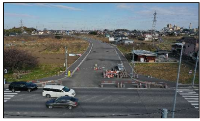
飯能寄居線バイパスと連携して災害時の緊急輸送の役割を果たします。