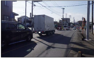
「平沢橋南」への延伸ルートを整備と合わせて交差点改良を行い、交通渋滞を緩和します。