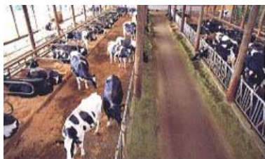
【フリーストール牛舎】