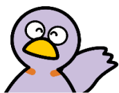
Kobaton, la mascota de Saitama