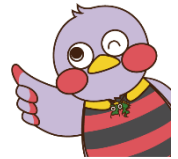
埼玉県マスコット 「さいたまっち」

埼玉県では、高等学校等に通う生徒の修学を支援するため、学費負担を軽減する制度や無利子で奨学金を貸し出す制度など、さまざまな修学支援制度を用意しています。下表にある各制度の詳しい内容や申請方法については、中面や裏面を御確認ください。