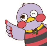
SAITAMACCHI, mascote da Província de Saitama

A Província de Saitama disponibiliza vários sistemas de auxílio financeiro aos estudantes do ensino médio, tais como o sistema de redução das despesas escolares, sistema de fornecimento de empréstimo sem juros, etc. Para mais detalhes sobre o conteúdo ou forma de requerimento dos sistemas listados abaixo, consulte a parte do meio e verso deste folheto.