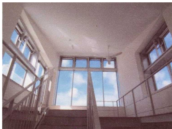
写真9 (上) 階段室上部の自動開閉装置付き排気用窓 (左下) 給気用窓 (下) 給気用スリット