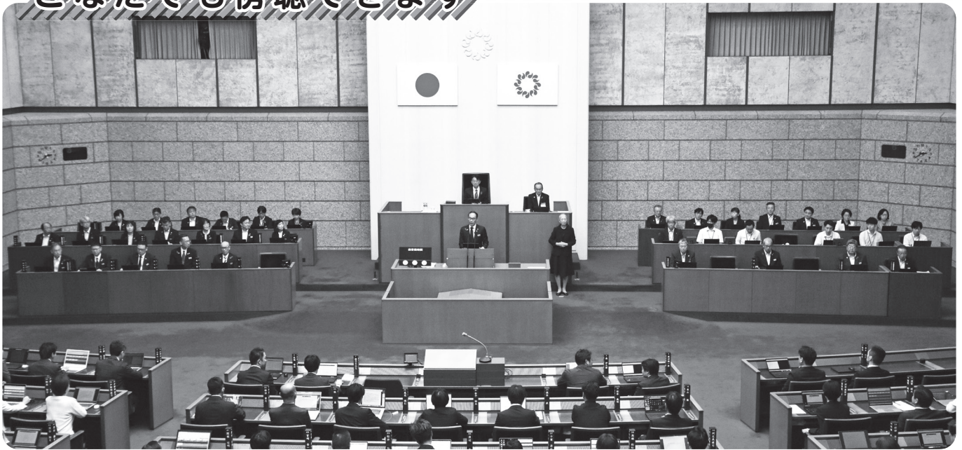
本会議場（令和7年9月定例会）

県議会の本会議は、県議会議事堂4階の傍聴者受付で手続きをしていただければ傍聴ができます。本会議の傍聴席は216席です。傍聴席とは別室で、乳幼児・児童のお子様と一緒に気兼ねなく傍聴できる専用スペースもご用意しています。