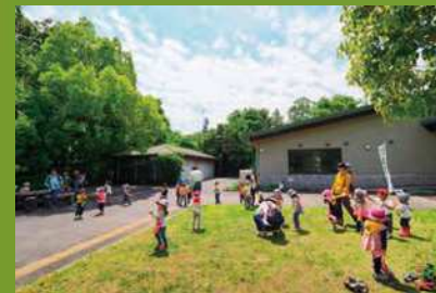
埼玉県自然学習センター・ 北本自然観察公園 (電話048-593-2891)

入館無料で、土日祝日を中心に、自然観察会や自然工作教室など様々な自然関連イベントを行っています。