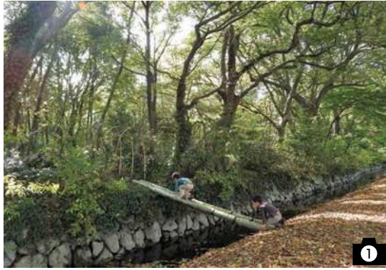
◀ 第19回コンクール 優秀賞「山崎山大冒険」