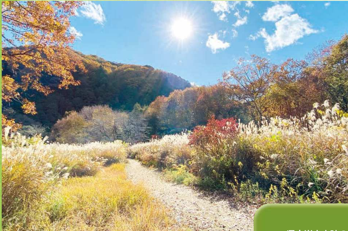
▲第26回コンクール 最優秀賞「秋探しの嵐山樹林地」

比企丘陵の中に位置し、大平山の斜面とそれに続く緩やかな斜面で、槻川の流れと一体となって、すばらしい景観をつくり出しており、埼玉を代表する景勝地の一つです。