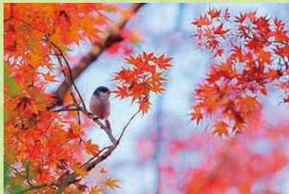
▲第22回コンクール 優良賞「嵐山溪谷のエナガちゃん」

比企丘陵の中に位置し、大平山の斜面とそれに続く緩やかな斜面で、槻川の流れと一体となって、すばらしい景観をつくり出しており、埼玉を代表する景勝地の一つです。