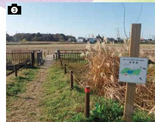
長崎第一自治会館