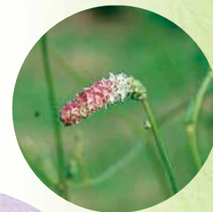
ナガボノフレモコウ

黒浜沼は谷地(低地に浅く水がたまり草が茂っている湿地)に元荒川の運んできた土砂が堆積してせき止められてできたものだ。 水辺には、様々な水生植物群落が見られるから観察してみてね。 また、黒浜沼とその周辺に広がる田園風景は、蓮田市を代表する風景の一つだよ。