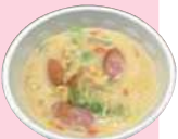
ホワイトシチュー