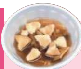
もやしとキノコの スープせんべい汁風