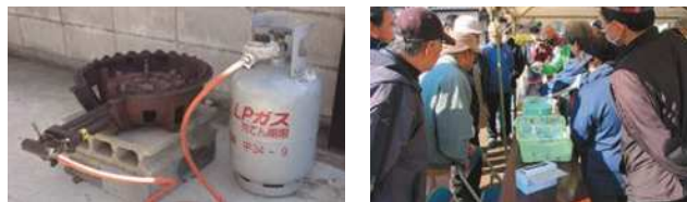
※実際の災害時には、この制度による出動や応援はできません。