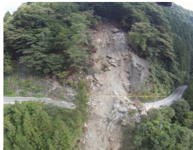
不安定な岩塊による再崩落発生