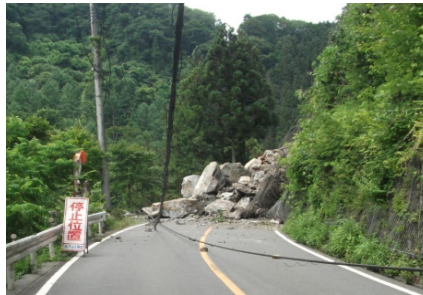
秩父側から現場を見た様子