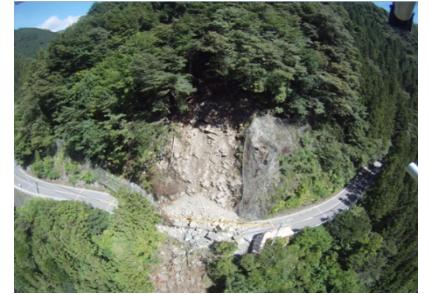
上空から現場を見た様子