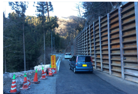
暫定供用開始時の様子