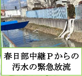
春日部中継Pからの 汚水の緊急放流