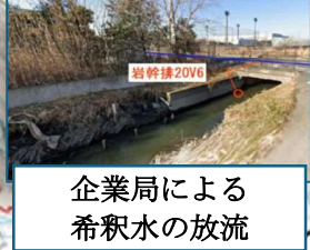
企業局による 希釈水の放流