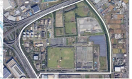
中川水循環センター 60ha (令和3年10月撮影)