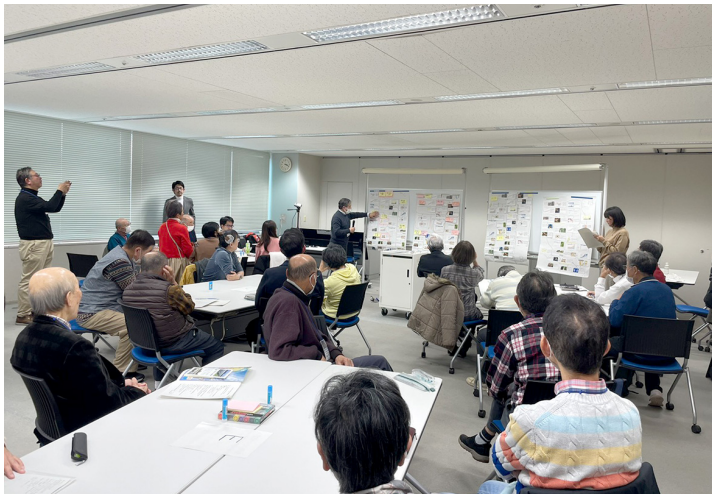
写真1-1 地球温暖化防止活動推進員研修

地域における地球温暖化対策の普及啓発活動の中核である地球温暖化防止活動推進員*に対し、能力向上に資する研修を実施しました。各推進員は、地元市町村の環境関係のイベントなどで活動を続けており、令和5年度の延べ活動数は5,074回となりました。