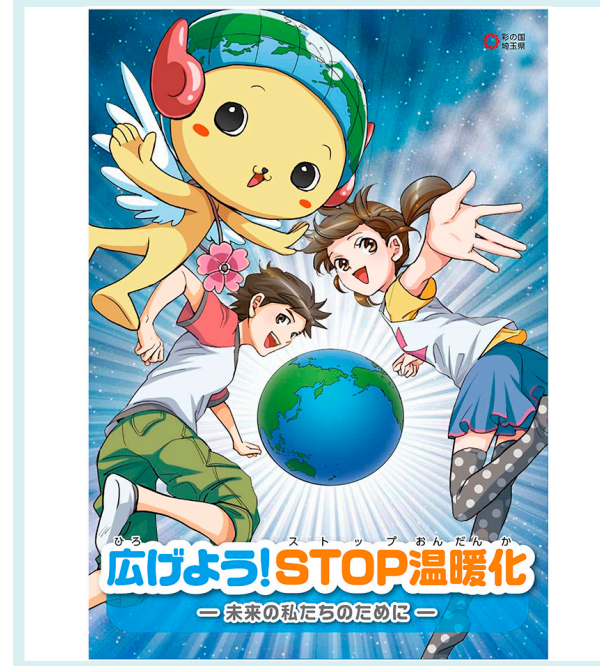
図1-3 漫画で学ぶ地球温暖化副読本