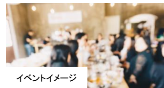
イベントイメージ