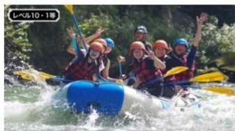
カヌーテラフティング 「貸切キャンプ&ラフティングツアー招待券」