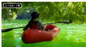
アムスハウス&フレンズ 「長瀬バックラフトツアー・ベア招待券」