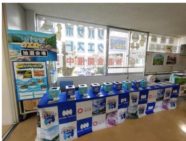
▲「リバサポ・クエスト」第 1 回抽選会の様子

「リバサポ・クエスト」は、リバサポ公式 LINE を利用し、川での活動等に参加するとポイントを貯めることができる仕組みです。