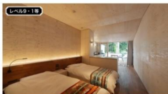
COMORIVER 「グランピングキャンピング宿泊券」