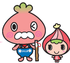
川島町マスコットキャラクター かわべえとかわみん

料理が得意な方、 家事や買い物が得意な方、 サポーターとして活動してみませんか？ 会員募集中！！