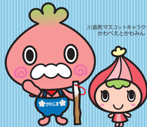
川島町マスコットキャラクター かわべえとかわみん

川島町にお住まいの 高齢者・障がい者の皆さんが 安心して生活できるよう ボランティアがお助けします！