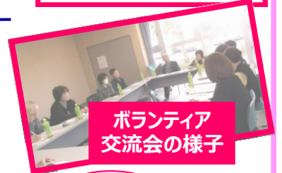
ボランティア 交流会の様子