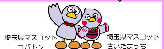
埼玉県マスコット コバトン 埼玉県マスコット さいたまっち

埼玉県県民生活部共助社会づくり課共助づくり担当 Tel：048-830-2819 Mail:a2835-10@pref.saitama.lg.jp