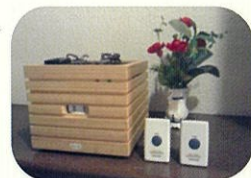
見守りリンクと緊急ボタン