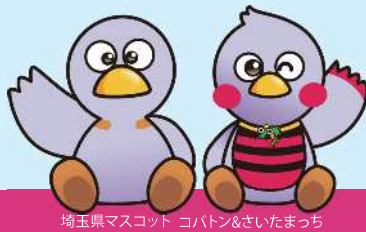
埼玉県マスコット コバトン&さいたまっちゃん