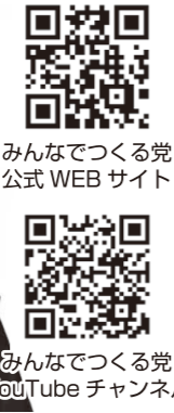
みんなで作る党 公式WEBサイト