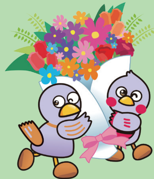
埼玉県のマスコット 「コバトン&さいたまっちゃん」