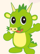
つなが竜又ウ (さいたま市)