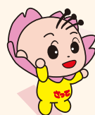
さっちゃん (幸手市)