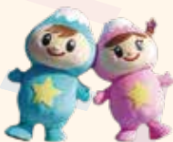
ふわっぴー (富士見市)