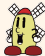
マップー&みどりん (松伏町)