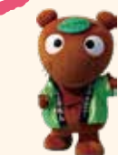
ムジナもん (羽生市)