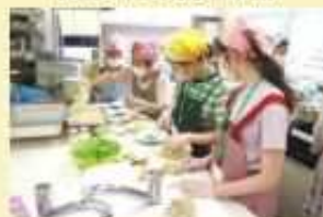
須磨区（こども食堂準備）