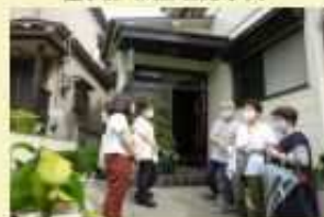
垂水区（高齢者見守り）