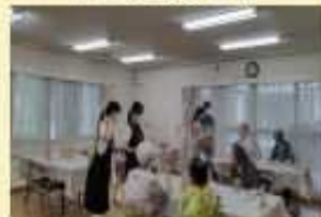
灘区（ふれあい喫茶）