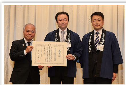
株式会社小山本家酒造