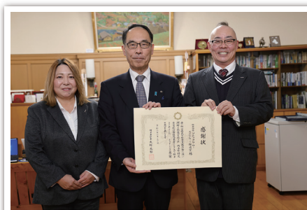
株式会社ソニックフロー