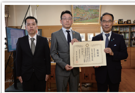
株式会社エコ計画