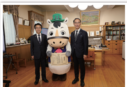
埼玉県浦和競馬組合