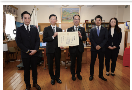
株式会社富士薬品