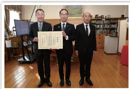
一般財団法人 さいたま住宅検査センター