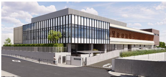
※各室の写真は 熊谷児相 (一時保護所)