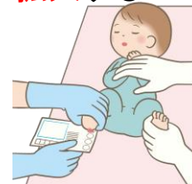
採血の様子 (かかとから採血)