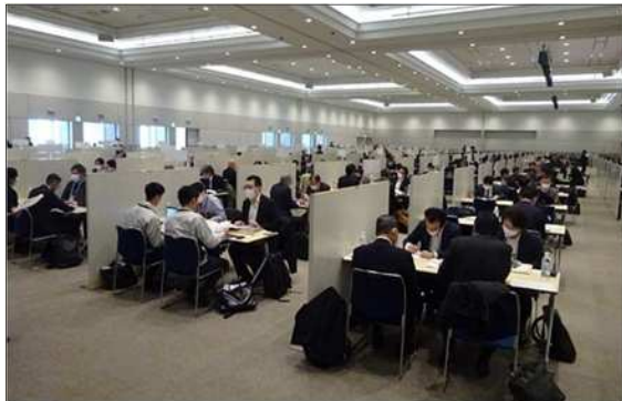
令和5年度に実施した「九都県市合同商談会2024」の商談風景 (会場:パシフィコ横浜 アネックスホール)

首都圏産業の国際競争力の強化を図るため、平成20年度から九都県市(埼玉県、千葉県、東京都、神奈川県、横浜市、川崎市、千葉市、さいたま市、相模原市)が連携して合同商談会を開催し、今回で17回目を迎えます。