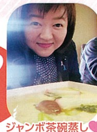
ジャンボ茶碗蒸し