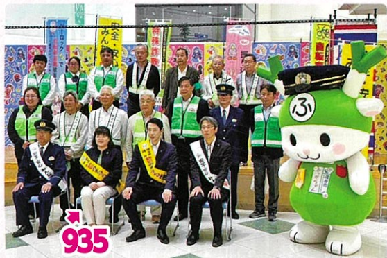
防犯のまちづくりキャンペーン@アリオ深谷