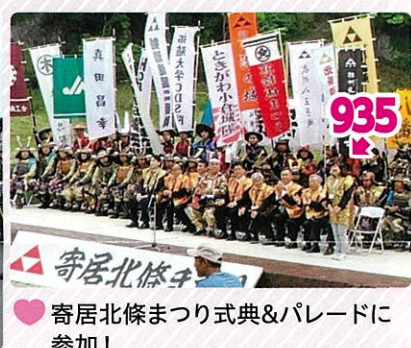
寄居北條まつり式典&パレードに 参加！