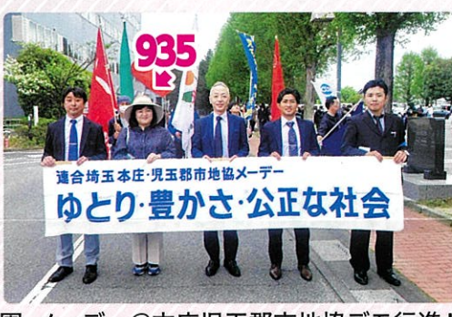
メーデー@鐘塚公園、メーデー@本庄児玉郡市地協デモ行進！