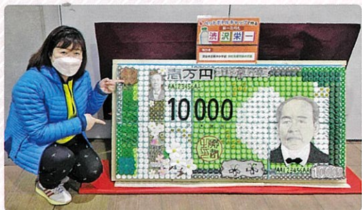
どこでも新一万円札のPRをしています！