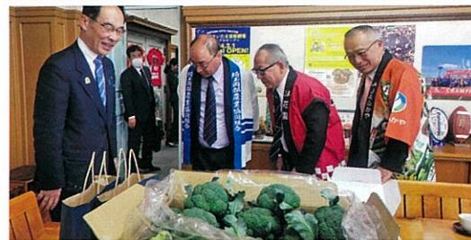
ブロッコリー指定野菜へ向けた知事への要望活動