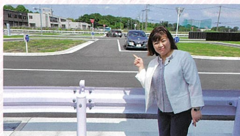
新規オープンした岩槻高齢者講習センターへ視察。是非ご利用下さい！