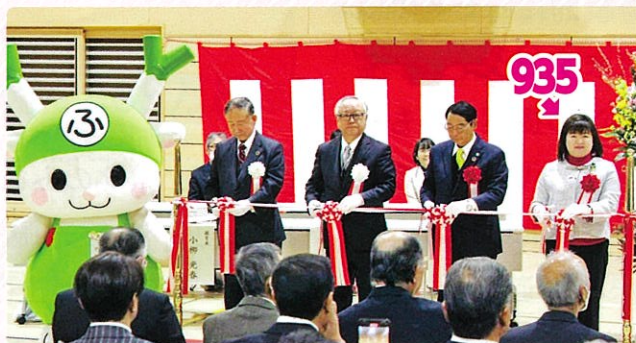
川本地区複合施設『ワモア川本』落成式