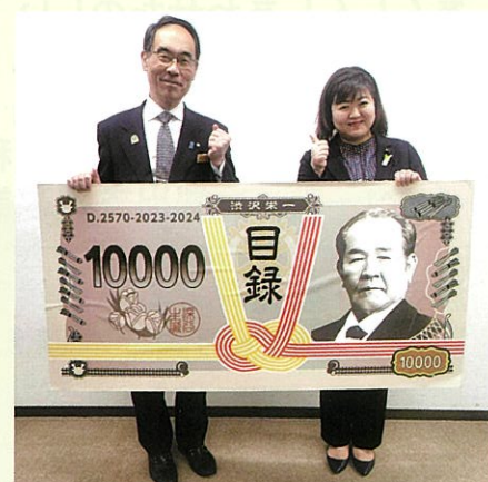
いよいよ新一万円札の発行です