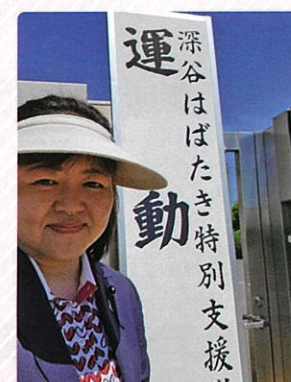
はばたき特別支援学校の 運動会では8年ぶりの 再会がありました！