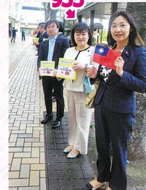
台湾東部沖地震 被害者支援の募金活動