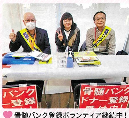
骨髄バンク登録ボランティア継続中！