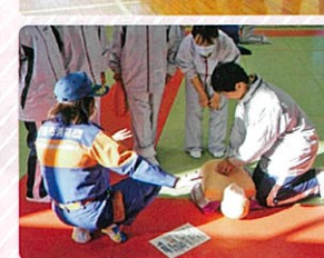
女性消防団活動も 頑張ってます！