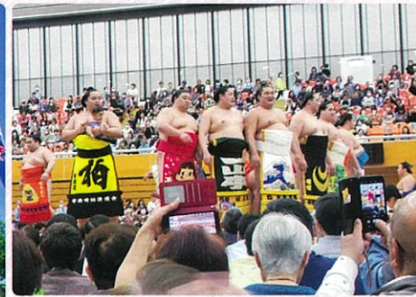
渋沢栄一—万円札発行記念の 深谷場所開催！