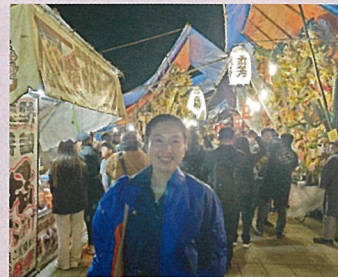
消防団で見回り活動