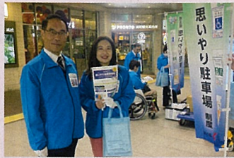
障害のある方や要介護高齢者、妊産婦の方々に利用証を交付し、優先駐車場に停めやすくします