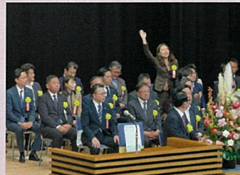
長年消防活動に尽力されている消防職員や団員の皆様へ感謝いたします