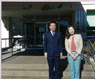
埼玉県の福祉のセーフティーネットです