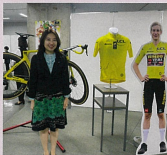
さいたまクリテリウム