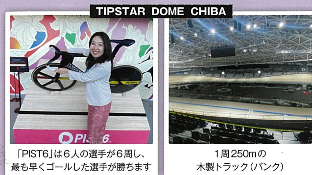
「PIST6」は6人の選手が6周し、最も早くゴールした選手が勝ちます

11月20日から21日にかけて、総務県民生活委員会で千葉市にある競輪場「TIPSTAR DOME CHIBA」と神奈川県藤沢市にある「神奈川県立スポーツセンター」を視察しました。旧千葉競輪場は、売上減少から廃止も検討されましたが、民間資金100%で建て替えられ、新規顧客獲得を目指し、スポーツエンターテインメント性の高い「250ケイリン(PIST6)」という種目へ。本県には大宮競輪場があり、運営の課題解決へのヒントをいただきました。