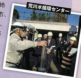
荒川水循環センター

修繕費確保のため、荒川左岸北部地域(熊谷市、行田市、桶川市、鴻巣市、北本市)と利根川右岸地域(本庄市、美里町、神川町、上里町)では、市町の負担が増えることが決まりました。技術の進歩を公共インフラの再整備に繋げ、県民負担を少なくする努力をしています。