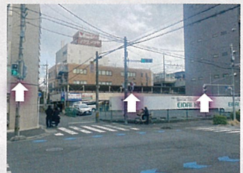
車道の信号のみで、歩行者用信号がありませんでした。通学路でもあったため歩行者用を新設していただきました。