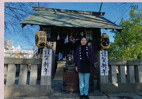
元旦に地元神明社にて福だるまを配らせていただきました