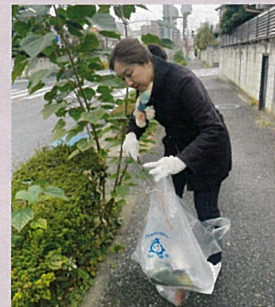
秋のごみゼロキャンペーン