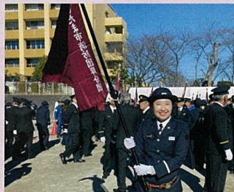
消防団員として旗手をつとめました