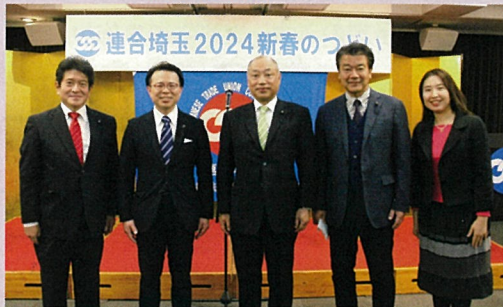
連合埼玉新春のつどい