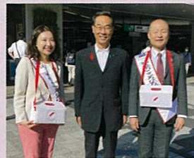
赤い羽根募金活動

社会福祉推進議員連盟で知事や浦和第一女子、市立浦和高校、浦和ルーテル初等部の皆様と