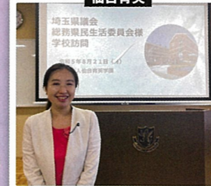
自主性を重んじる点が野球の強さの秘訣でもあるようです