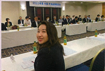
連合埼玉主催 市長・町長政策懇談会