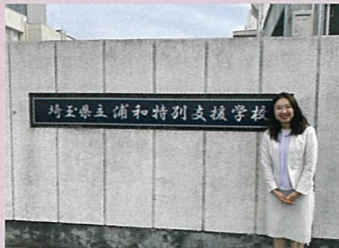
埼玉県立 浦和特別支援学校