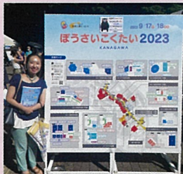
ぼうさいこくたい 2023