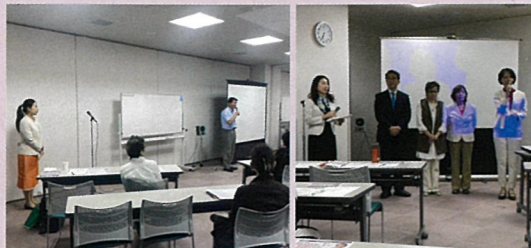
モノ言う生活者たち講演会