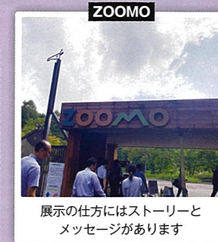
展示の仕方にはストーリーとメッセージがあります

また、9月11日、12日には、公社事業対策特別委員会で公民連携プロジェクトの先進事例を学びに岩手県「盛岡動物園ZOOMO」、紫波郡のまちづくり「オガール」を訪れました。