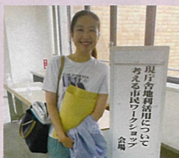
さいたま市役所跡地利用について考える