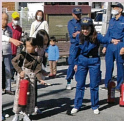
南自治協会の防災訓練