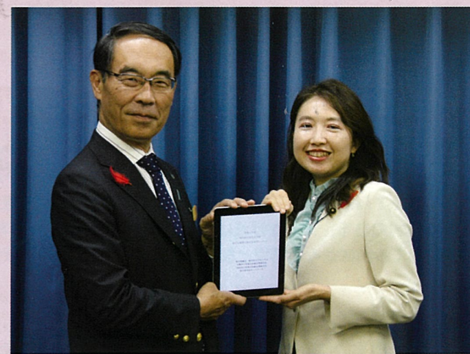
埼玉県の来年度の予算について要望書をお渡ししました。詳しくは中面右下へ。