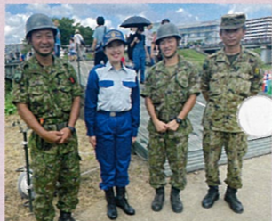
九都県市合同防災訓練