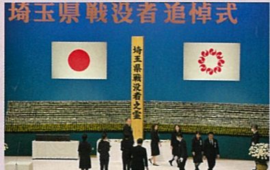
埼玉県戦没者追悼式