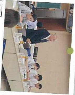
9月 県内の各種団体様との意見交換会。50近い団体様より、様々なご意見を頂きました。