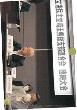
5月 立憲民主党埼玉県連の臨時大会。県連幹事長に、党務もしっかりとやってまいります。