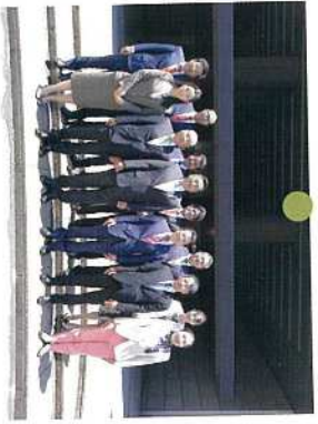
5月 新しい会派「埼玉民主フォーラム」。12人で構成され、会派の幹事長のお役を頂きました。