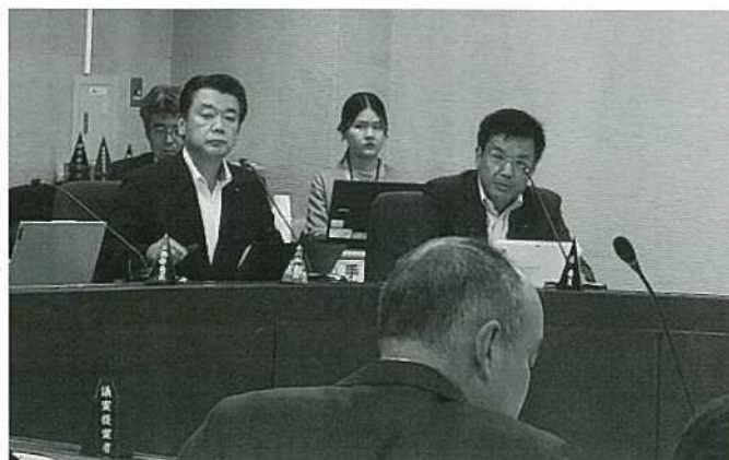
福祉保健医療委員会