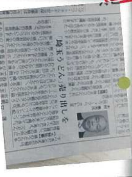
12月 一般質問に登壇。「埼玉うどん」を売り出すよう大野知事に質問しました。