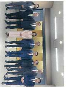
1月 改選前の会派「埼玉民主フォーラム」。8人で会派を組んでいました。