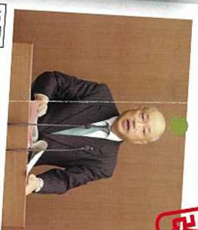
12月 一般質問に登壇。 県立高校のエアコン代への支援について。 入試改善についてなど、10項目を質問しました。