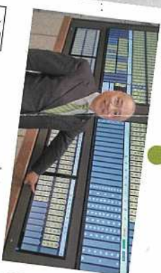
4月 初登庁。これからも地域のみなさまとともに汗をかいてまいります。