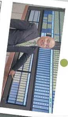
4月 初登壇。これからも地域のみなさまとともに汗をかいてまいります。