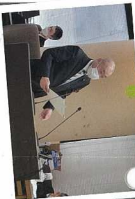
3月 予算特別委員会で大野知事をはじめ執行部に質問。