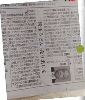
12月 埼玉のうどんを観光資源として活用するべき。「埼玉うどん」を売り出すよう、大野知事に提案しました。