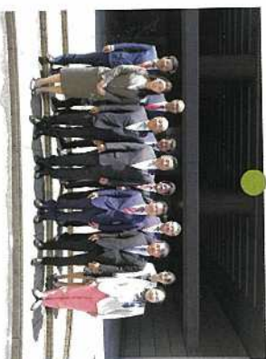
5月 新しい会派「埼玉民主フォーラム」。12人で構成され、会派の幹事長のお役を頂きました。