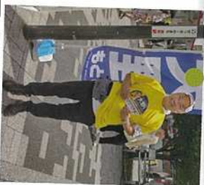
7月 8月 猛暑の中での知事選挙。大野知事を全力で応援し2期目の当選。