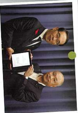
10月 大野知事に新年度の予算要望を提出しました。