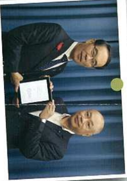
10月 大野知事に新年度の予算要望を提出しました。