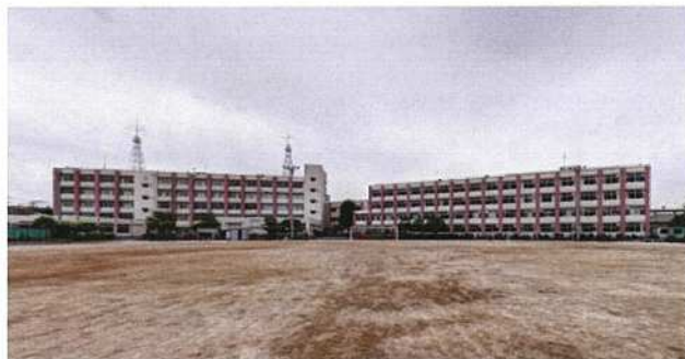
埼玉県立大宮工業高校

県教育委員会では、社会のニーズに対応した特色ある県立高校づくりを推進するため、再編整備による新校の概要や基本方針などを内容とする「魅力ある県立高校づくり第2期実施方策」を策定しました。