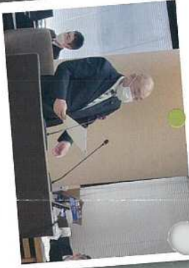
3月 予算特別委員会で大野知事をはじめて執行部に質問。