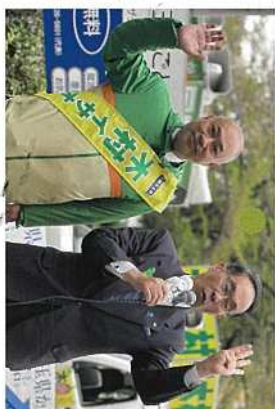
4月 統一地方選挙。 20,205票を頂いて、5期目の県議会議に送って頂きました。