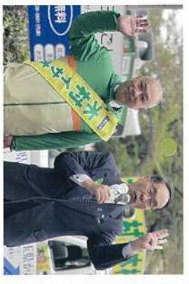
4月 統一地方選挙。統一地方選挙。20、205票を頂いて、5期目の県議会に送って頂きました。