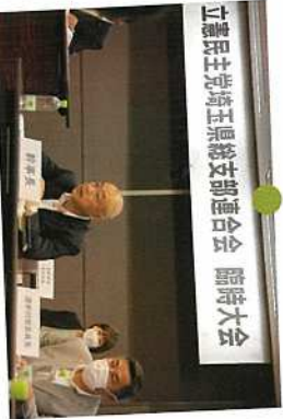
5月 立憲民主党埼玉県連の臨時大会。県連幹事長に。党務ちしつかりとやってまいります。