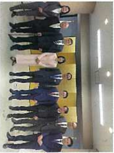
1月 改選前の会派「埼玉民主フォーラム」。8人で会派を組んでいました。