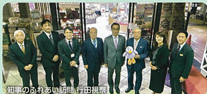
知事のふれあい訪問 行田視察