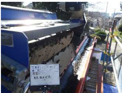
脱水された堆積土

池の水を貯めたまま底泥を汲み上げ、その場で脱水処理できる技術。 池の中の堆積土は窒素、リン、カリウムなどの栄養素が十分に含まれており、脱水された用土は団粒化しているため保水性が良好で、市販の黒土以上の植物の成長が見られる。さらに有効土壌菌を混合することにより植物・農作物の育苗土に最適となる。