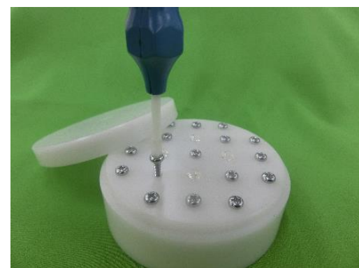
ネジセット兼収納ケース